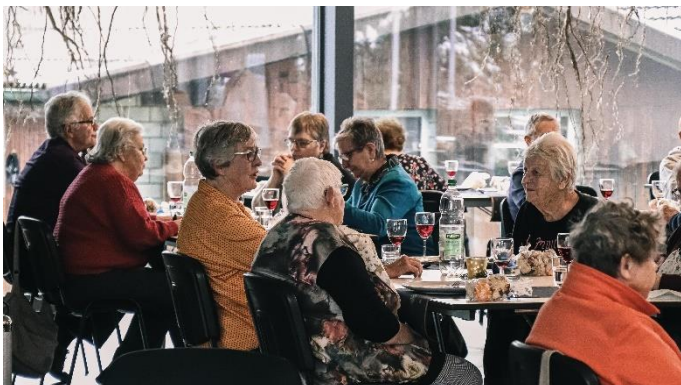
An der Seniorenadventsfeier sah man viele strahlende Gesichter.

Am 23. Januar findet um 09:00 Uhr unser nächster «Kennenlern Morgen» bei Kaffee und Gipfeli statt: Immer wieder schnuppern interessierte Leute bei uns herein. Genau für solche Personen ist dieser Anlass gedacht. Du wirst die Angestellten sowie die Gemeindeführung persönlich kennenlernen, viele Informationen über die seetal chile erhalten und bei der Integration in die Gemeinde Hilfestellung bekommen.