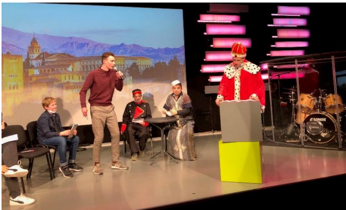
«Herodes – ein König wie du und ich» war das Thema unserer Weihnachtsfeier. Hier werden die Theater aufgenommen.

Unser Gebetsteam, das in jedem Gottesdienst im Einsatz steht, wird das prophetische Gebet ein Stück weit in ihre Arbeit integrieren. So werden sie in Zukunft beim Gebet für Menschen vermehrt ihr Herz mit der Frage auf Gott ausrichten: «Was willst du dieser Person sagen?» Selbstverständlich werden sie Eindrücke nur weitergeben, wenn dies gewünscht ist. Dies soll in einer grossen Freiheit geschehen. Wir gehen davon aus, dass Gott zu uns redet. Wahr ist aber auch, dass Gott nicht beliebig verfügbar ist. Über den Geist Gottes steht geschrieben, dass er weht, wo er will (vgl. Johannes 3,8). Dieser Wahrheit wollen wir in diesem neuen Setting Rechnung tragen. Ja, Gott spricht zu uns. Er spricht zu dir! Machen wir diese Eindrücke doch vermehrt einander zugänglich und ermutigen uns dadurch!